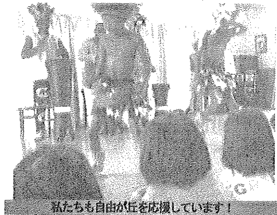
私たちが自由が丘を応援しています！

午後から公園に行き『特大熱気球飛ばし』を行いました。太陽の光で暖められ浮き上がり、熱気球を持って走る子・少し離れて見ている子など思い思いに楽しめていたのではないかと思います。公園から戻ってからは、「なぜ気球は浮かんできたのか？」についての紙芝居。小学校高学年レベルの内容ながらも一生懸命に聞いていました。工作に料理に学びの多い一日となりました。(鈴木美彩子:記)