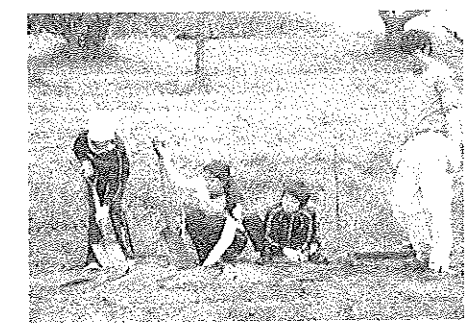
◇余市教育福祉村にて、暑い中で畑・畝作業

一般的な課題・知識に留まることでは、自発自覚的態度や方向性が明確になりません。出来るだけ生の情報に接する、自ら調べる、多くの体験機会を持つ、仲間との共通理解を図るなどが必須となります。更に身近な大人、特に教師や親がこれをわが身のテーマとして語り実践する人でなくては、生徒への共感はずっと得られないでしょう。(受験科目に関らなければ簡素化・省略されてしまうというのは論外のことです)それらを通じて得た学びを、生活スタイルや価値判断に反映していくことがこの科目・教育の本筋・目的として求められます。